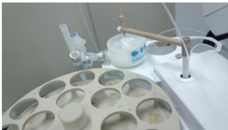
アジレント・テクノロジー製 ICP-MS に取り付けたリンスポート

ピューリックωシリーズで製造した超純水をアジレント・テクノロジー株式会社製ICP-MSオートサンプラー(I-AS)専用設計したリンスポートを使用して“掛け流し”とすることで、常にフレッシュな超純水でICP-MSへの導入部を洗浄することが可能となり、分析結果の安定化を図ることができます。